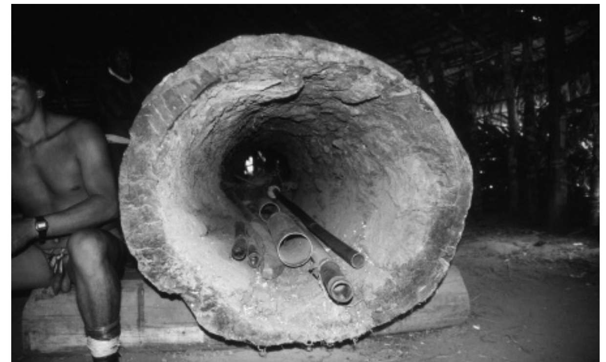
Fig. 4. Troca no (tambour à signaux) géant taillé dans le tronc d'un arbre creux, conservé dans la maison des flûtes, village kamayurá, Haut Xingu, 2002.

Le yawari est réalisé de nombreux mois (voire de nombreuses années) après la sépulture du mort, c'est-à-dire quand son corps a déjà subi tout le processus de décomposition et qu'il ne reste que les os, qui n'ont pas encore été déterrés. Le mort est représenté (au sens de représentant défini par Gell 1998) par un arc de bois ainsi que par une effigie de paille et de bois installée au centre du village (fig. 3). Tout comme les Pléiades, le mort renaît en juin, bien que sous la forme d'un mannequin.