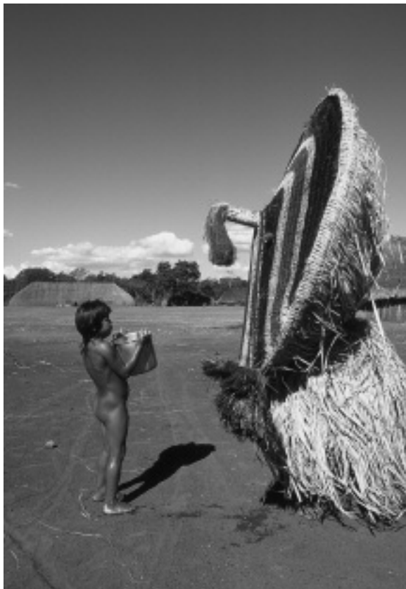
Fig. 5 Fillette effrayée par un masque Atujuwá sur la place de Piyulaga, août 2000. Atujuwá est l'un des esprits les plus dangereux et redoutés du monde surnaturel xinguanien.

C'est vers cet objet rituel que convergent les actions centrales des participants. Pendant les deux semaines que dure le yawari , l'effigie du mort est la cible de centaines de dards (fig. 3) avant d'être détruite par le feu avec son arc (fig. 6). Cet acte clôt le rituel. Ainsi, ce ne sont pas des os, matière (quasi) impérissable, que l'on déduit l'idée de la permanence du mort pendant le rituel, mais d'un objet fabriqué à partir d'une matière périssable comme la chair elle-même.