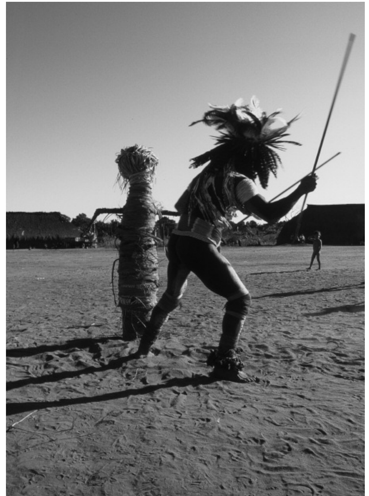
Fig. 3 Homme wauja visant l'effigie d'un mort yawalapiti lors d'un rituel post-funéraire yawari , village yawalapiti, Haut Xingu, 2000.

La destruction rituelle définitive des masques wauja par le feu peut durer plusieurs mois ou même plusieurs années, mais ce qui est finalement détruit dans ces masques subissait déjà un processus intentionnel et continu de perte du statut de personne. Même abîmés, abandonnés ou oubliés, les objets conservent une subjectivité potentielle susceptible d'être actualisée à travers le contact avec des humains, des animaux, des morts ou même d'autres objets ; les éclipses et autres phénomènes célestes peuvent également re-subjectiver les objets. La destruction totale d'un objet ne signifie pas que son statut de personne est réduit à un hypothétique degré zéro, mais uniquement l'élimination du représentant d'une population d'objets.