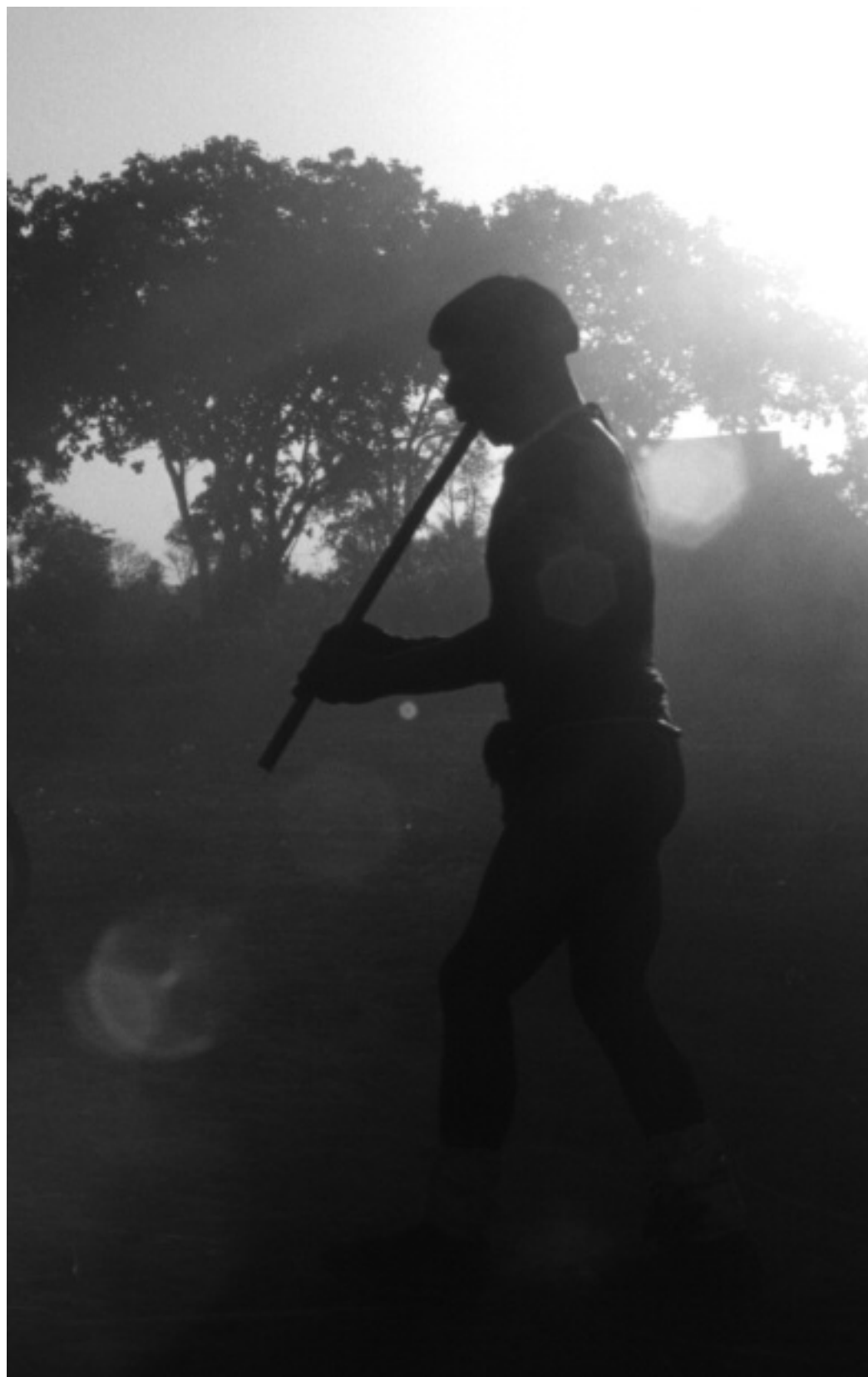
Fig. 1 Flûtiste wauja jouant du ka wo kátã pendant le rituel Apapaata i ñã u . Ka wo kátã est une version réduite, en bambou, de la flûte sacrée ka wo ká . Légère et à la sonorité aiguë, elle est généralement utilisée au début de l'apprentissage des puissants chants de ka wo ká , village wauja, 2000.