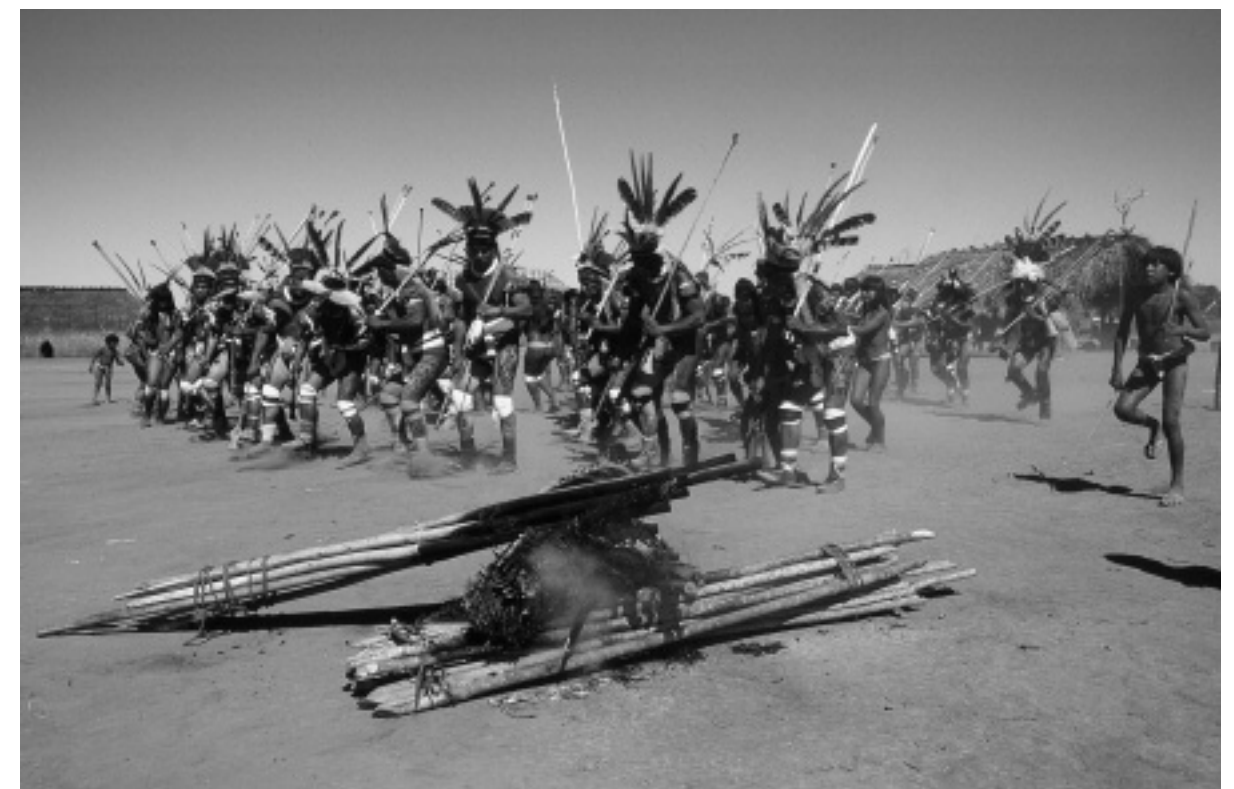
Fig. 6 Xinguanien dansant devant l'effigie brûlée pendant le rituel post-funéraire yawari , village yawalapiti, 2000.

Les Apus Pariacaca et Colquepunku formaient une synthèse duelle de l'espace-temps. Les données ethnographiques de Randall (1982) permettent de supposer que la disparition du rituel Pariacaca a conduit progressivement à une reconstitution de la dualité du rituel sur le Colquepunku. À partir de la fin du XVIII e siècle, en effet, les Indiens élaborèrent une double lithomorphose du Christ sur le Colquepunku, plaçant un second Christ en