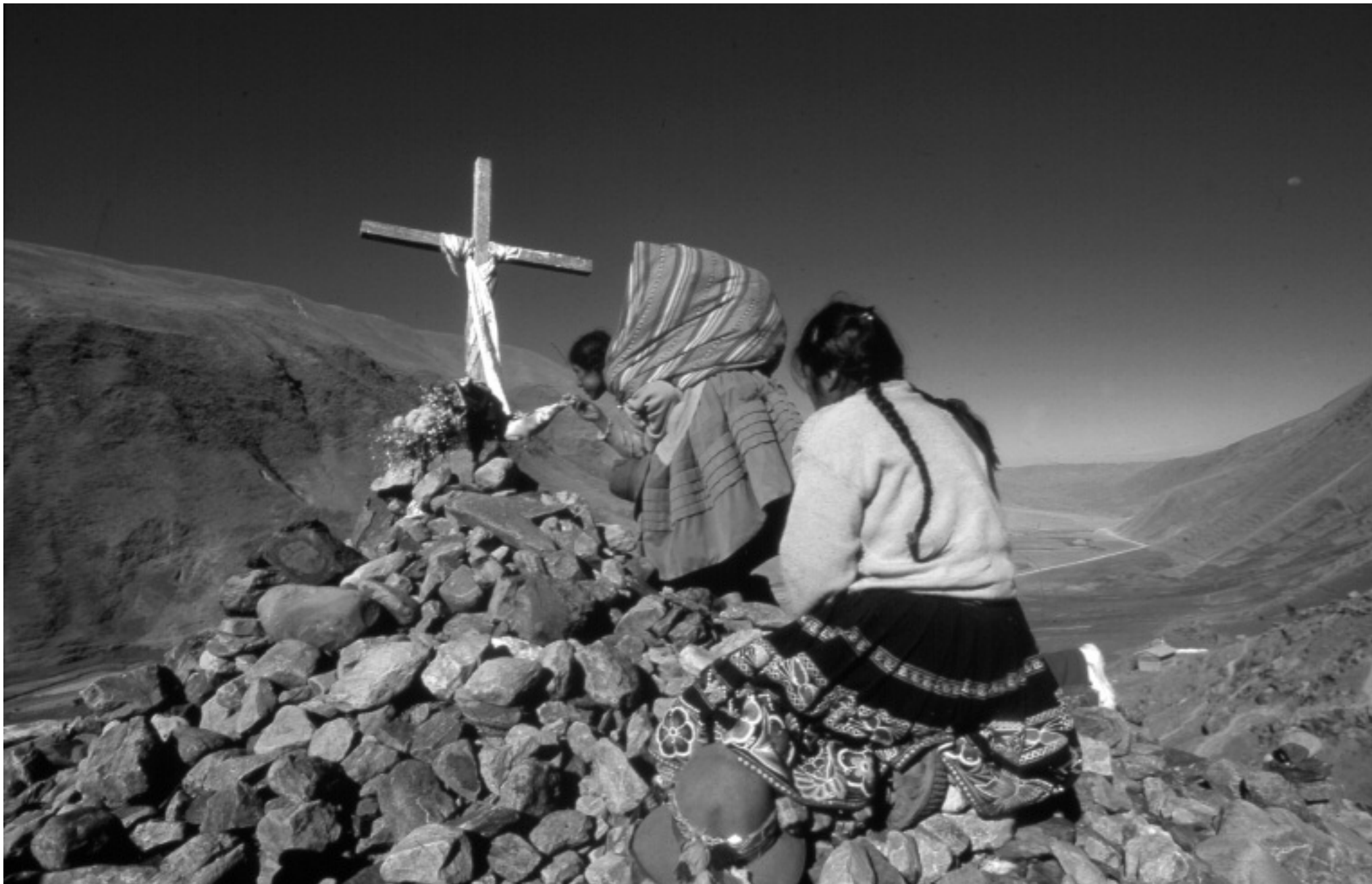
Fig. 8 Franck Charton, l'un des nombreux oratoires qui jalonnent l'itinéraire vers le sanctuaire de Qoyllurit'i. Les pèlerins s'y prosternent en priant à la fois Dieu et les apus , montagne-déités © Franck Charton.

ceinte, où régnait un silence sépulcral. Inquiets, un groupe d'hommes défonça la porte et trouva, magnifiquement allongé sur la table, le Christ, le sac rempli de pièces à ses côtés. Le Christ de la Soledad avait été sculpté par des anges, conclurent alors les Huaracinos.