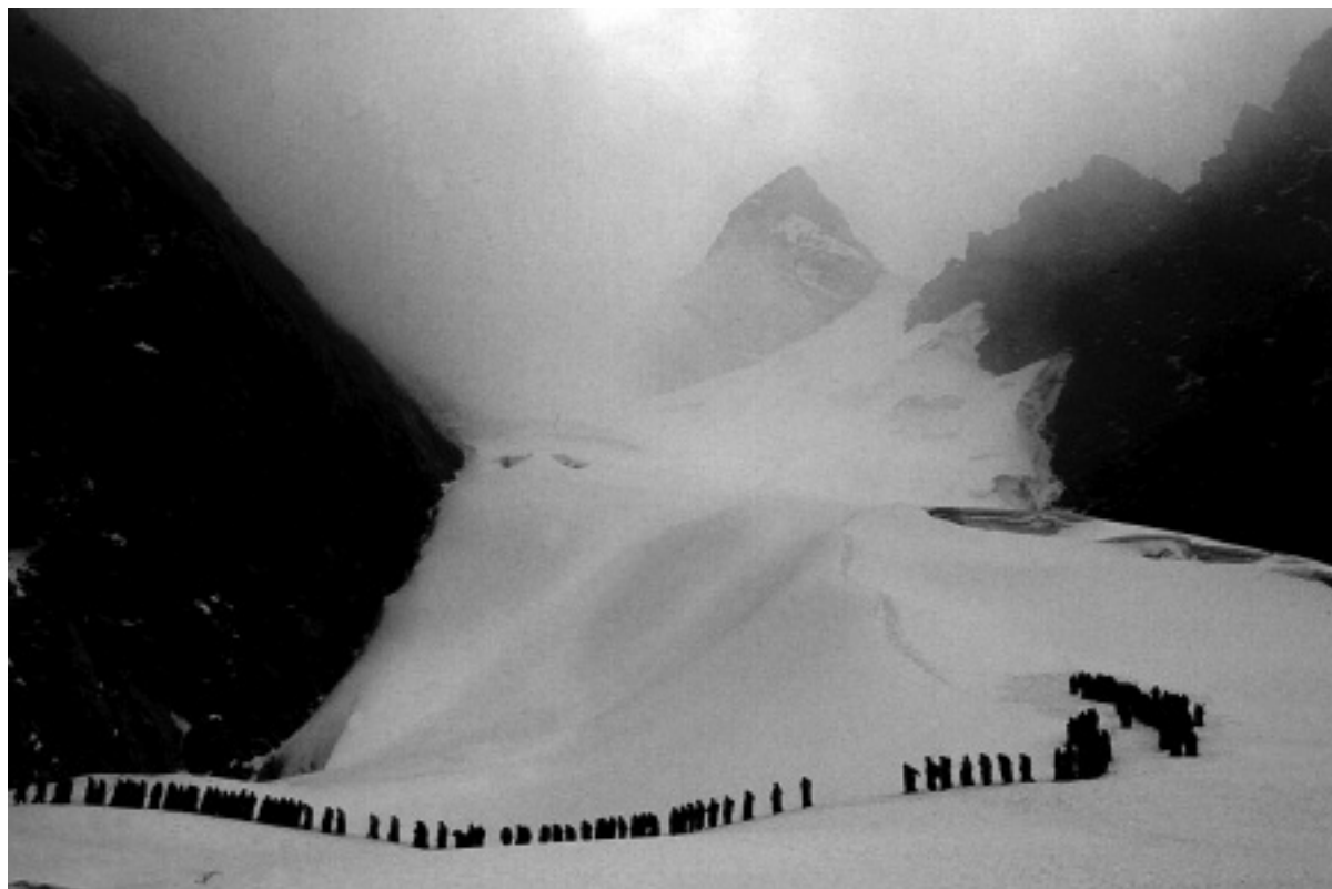
Fig. 9 Franck Charton, grande procession des Ukukus (« hommes-ours ») sur le glacier de Colquepunku, après la nuit centrale du culte, où ont lieu une solennelle « messe des glaces » et le rituel suivant : 1. prélèvement de la glace, semence sacrée de la divinité tutélaire, pour irriguer l'autel du sanctuaire de Qoyllurit'i et le parvis des églises de Cusco, et 2. « andinisation » des croix sur le glacier sacrificiel © Franck Charton.

Traduction du portugais par Maira Muchnik.