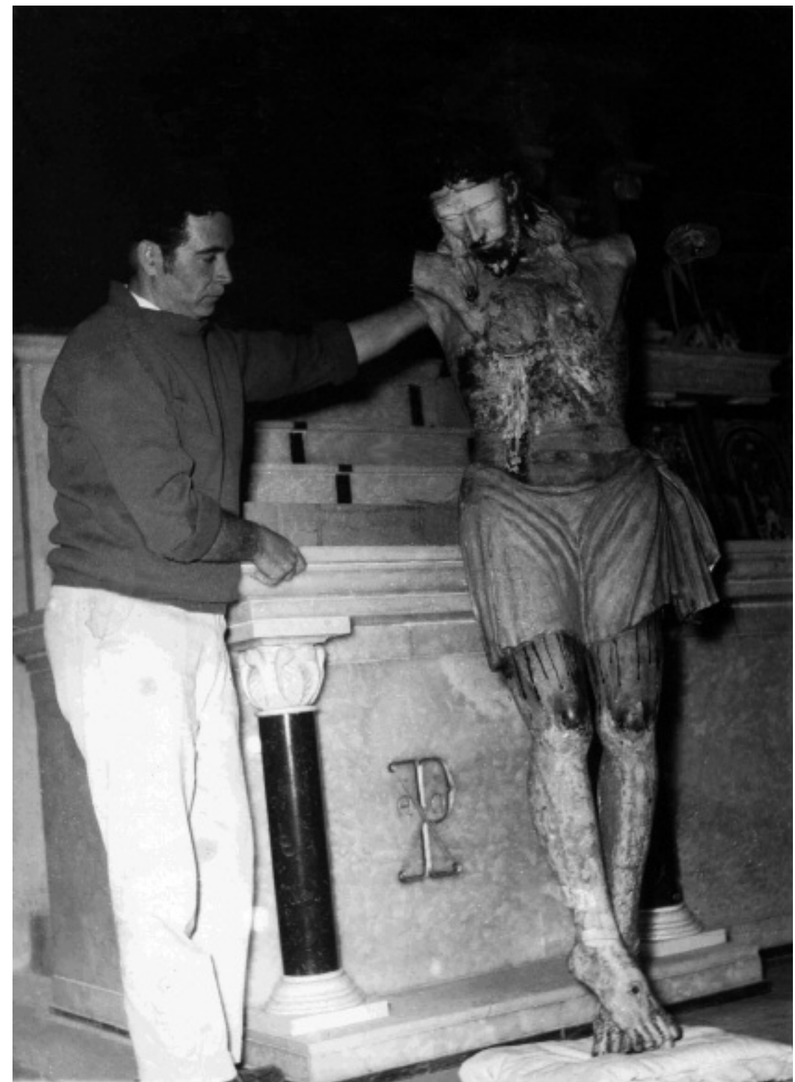
Fig. 7 Señor de la Soledad (Seigneur de la Solitude) sauvé de l'incendie de 1965, Huaraz, Pérou.

La version « mythique », ou « des fidèles », raconte qu'il y a des siècles arrivèrent à Huaraz deux inconnus qui se disaient sculpteurs. Le prêtre responsable du Templo de la Soledad leur commanda alors un Christ et les paya par avance. Les sculpteurs s'enfermèrent à huit clos et commencèrent à travailler. Les personnes qui passaient par là entendaient à peine le bruit des outils. Un beau jour, le bruit cessa et personne ne sortit de l'en-